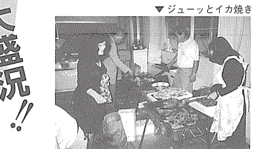
▼ジュースとイカ焼き