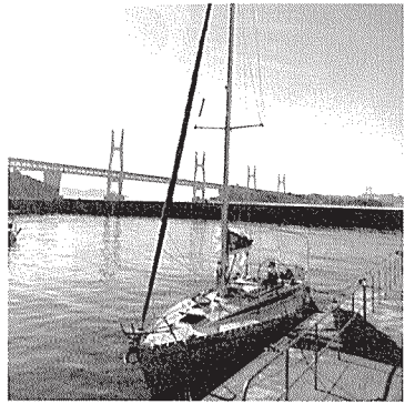
■瀬戸大橋へクルージング