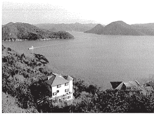
■東地区よりの風景

若葉が目にしみる季節の到来となりました。会員の皆様におかれましては益々ご健勝の事とお慶び申し上げます。