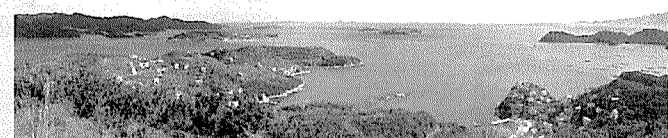
▲鴻の鳥山山頂から東南方向を眺める

別荘の建ち並ぶ鴻島の山頂(鴻の鳥山)は、360度の大自然のパノラマが広がる絶景ポイントであり、周辺の日生諸島をはじめ、遠くには家島諸島、小豆島を眺めることができる。港には案内板などは無いが、別荘の間を山頂目指して登ると、20~30分程度で登山口にたどり着き、そこから10分で山頂。知る人ぞ知る瀬戸内海の展望地である。