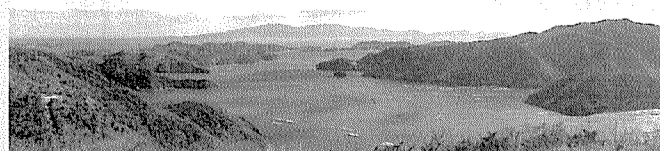
▲夕立受山展望台から見た瀬戸内海。遠くに小豆島が見える。

夕立受山(標高210m)からは日生諸島が一望できるとともに、虫明湾など入り組んだ牡蠣の養殖用イカダのある風景を見ることが出来る。駐車場から山頂まで400m(徒歩約10分)と歩きやすく、展望台が整備されており、瀬戸内海らしい眺めを堪能できる。