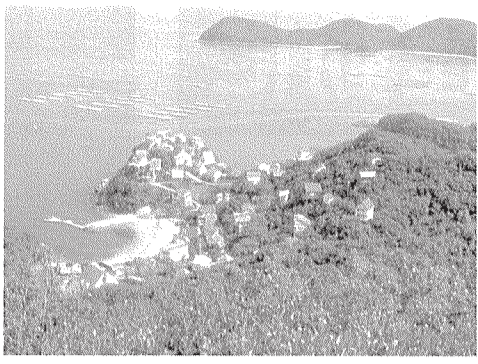
■鴻の島山 頂上よりの風景

新緑と海の輝きがまぶしい待ちこがれていた季節となりました。会員の皆様におかれましては、お元気に過ごされていますでしょうか。